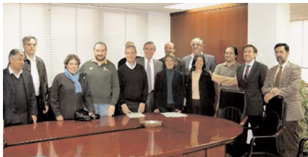
Asistentes a la firma de Convenios de la UNED

la situación general en la que estamos, podemos beneficiarnos de unas mejoras a cuenta del Convenio. El 1,5% conseguido, más dos pagas consolidables en nómina de 25.000 y 40.000 euros, suponen, sumadas a la subida anual aún por determinar, una mejora que sólo podemos valorar positivamente.