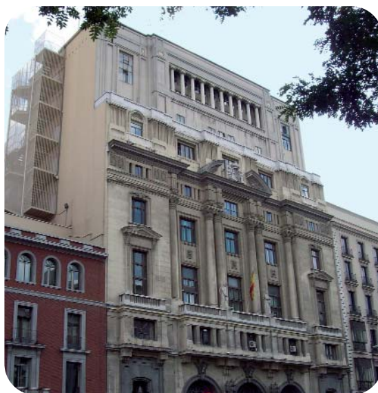
Ministerio de Educación

Para FETE-UGT es tema prioritario que no existan más demoras, que se aproveche lo positivo de la